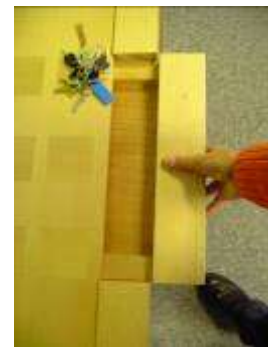
TIROIR INVISIBLE DANS LA TRAVERSE